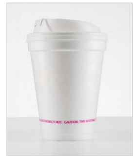
Ab 3.7.2021 verboten: Einwegbecher aus aufgeschäumtem Polystyrol

Allerdings sieht Artikel 4 der zugrundeliegenden EU-Richtlinie 2019/904 eine „ehrgeizige und deutliche Verminderung des Verbrauchs“ aller Einweggetränkebecher vor. Die Bundesregierung hat auf diese Vorgabe mit einer Änderung des Verpackungsgesetzes reagiert, die vorsieht, dass alle Betriebe, die Einwegbecher zur Bereitstellung von Getränken im Außer-Haus-Konsum nutzen, ab dem 1.1.2023 ebenfalls die Mitnahme in Mehrwegbechern anbieten müssen.